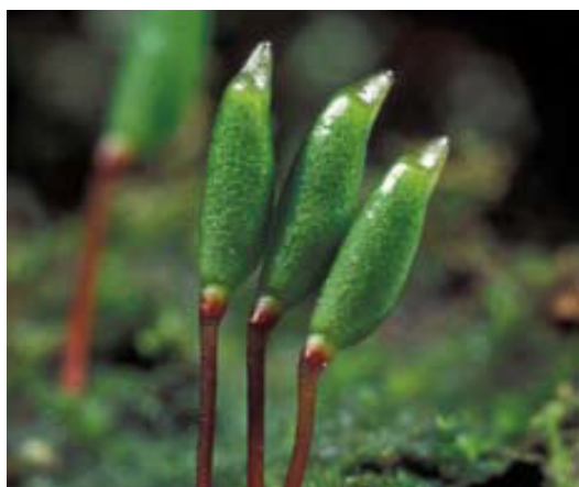
Grünes Koboldmoos (vergrößert)

Das Grüne Koboldmoos ist eine sehr seltene Moosart, die in Baden-Württemberg nur in niederschlagsreichen Gebieten vorkommt (Schwäbisches Keuper-Lias-Land, Schwarzwald, Schwäbische Alb). Es wächst dort vornehmlich in luftfeuchten, mehr oder weniger tiefschattigen Wäldern auf mäßig zersetztem Nadelholz und modrigem Humus, besonders in Schluchtbereichen, an nordexponierten Hanglagen und an Bachrändern.